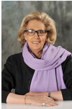
Energie : Mieux comprendre sa facture