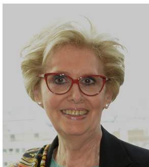
Se faciliter la vie